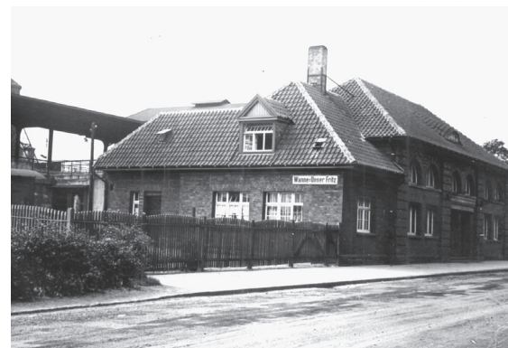
Der Bahnhof Wanne - Unser Fritz, um 1930. Die Bahnstrecke wurde im Jahre 1891 eröffnet. Die Zugstrecke führte von Wanne nach Gelsenkirchen Bismarck. Der Personenverkehr wurde 1993 eingestellt.

Kronprinz Friedrich Wilhelm – später Kaiser Friedrich III. (1831-1888, der nur 99 Tage als deutscher Kaiser und König von Preußen regiert hat) – stand Pate für die Namensgebung. Die Geburtsstunde der Zeche schlug am 18. September 1871. Die unterirdischen Kohlefelder umfassten 4,9 Quadratkilometer und reichten über die Ortsgrenze nach Herten und Gelsenkirchen. Der Malakowturm über Schacht 1 Sophie setzte die Akzente zur ersten Kohleförderung, die 1875 in Gang kam. Darüber hinaus wurde der Malakowturm das Wahrzeichen des Stadtteils.