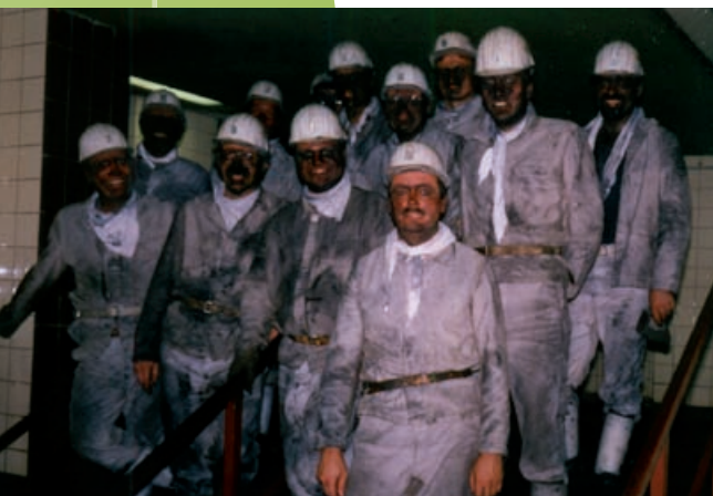
Grubenfahrt auf der Zeche Unser Fritz, am 28. Mai 1991.

Im Zuge der Wirtschaftskrise Mitte der 1920er Jahre und der daraufhin erfolgenden Rationalisierungsmaßnahmen wurde zunächst der Betrieb der Kokerei eingestellt. Am 30. November 1928 folgte die Stilllegung des gesamten Grubenbetriebes. Im Jahre 1929 kamen die Grubenfelder an die Schachanlage Consolidation in Gelsenkirchen. 1938 erfolgte die Zusammenfassung im Verbund mit der Nachbarzeche Consolidation. Die Schächte der Zeche Unser Fritz dienten fortan nur zur Seilfahrt, zum Bergeversatz und zur Wetterführung. Nach Gründung der Ruhrkohle AG wurde die Schachanlage Consolidation/Unser Fritz und Pluto 1970 zu einer Werksdirektion zusammengefasst. Im Jahre 1987 wurde Schacht 1 verfüllt. Das einzige Gebäude auf dem brachliegenden Gelände der ehemaligen Zeche Unser Fritz, der Malakowturm, befindet sich heute in der Obhut der Dortmunder Stiftung Industriedenkmalpflege und Geschichtskultur. Auf dem geräumten Zechenareal soll in Zukunft eine gewerbliche Nutzfläche entstehen.