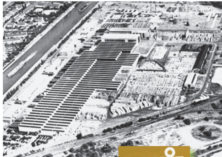
Hochansicht der Wanit Gesellschaft für Asbestzementherzeugnisse in der Schlossstraße 30, aufgenommen im Jahre 1971.

Drei bedeutende Unternehmen haben Mitte 1950 die Wanit Gesellschaft für Asbestzementherzeugnisse gegründet. Es waren: die Rhein Stahl Hüttenwerke, die Buderus'sche Eisenwerke und die Halberger Hütte. Die Produktionsaufnahme wurde auf einem 17 ha großen Gelände zwischen Kanal, Schloss- und Alleestraße im Jahre 1958 aufgenommen. Auf einer Platten- und einer Rohrstraße (später waren es je drei Fertigungsstraßen) wurden verschiedene Asbestprodukte als Brandschutz, Rohrisolierung, und Dachdeckung für den Hoch- und Tiefbau hergestellt. Anfang der 1980er Jahre waren in dem Betrieb an der Schlossstraße 30 bis zu 750 Mitarbeiter beschäftigt.